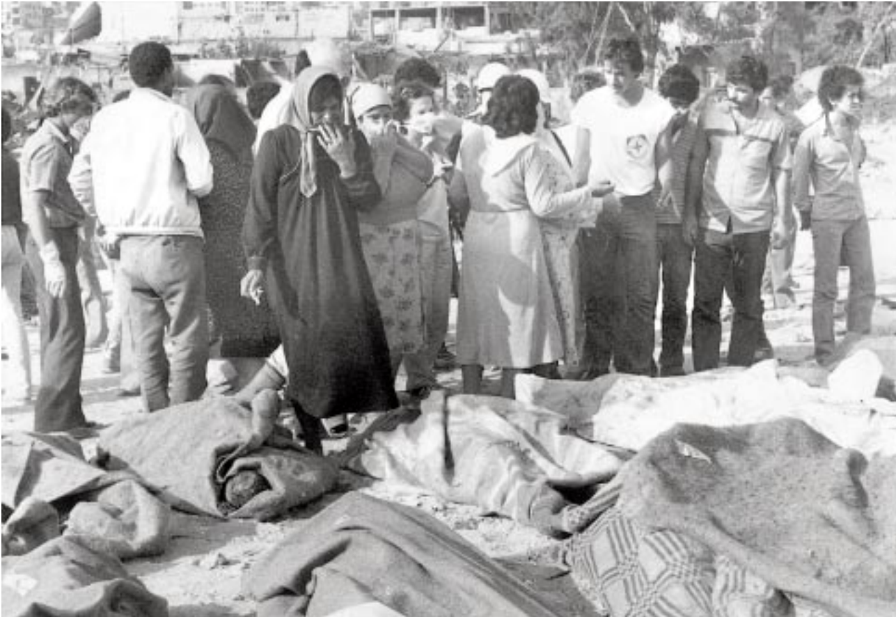
אחרי הטבח בסברה ושתילה. על המושע להיענות, כמובן, בדרך זו או אחרת