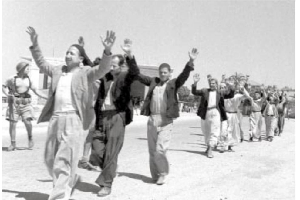
פליטים פלסטינים מרמלה ב'48'. המדינה הפלסטינית שתקום תהיה מדינת פליטים פליטים יהודים בבדפשט ב'45'. חלק עיקרי מהחרדה, הפראנויה הישראלית, נובע מהשוואה

הדיבור על השואה ב'באב אלשמס' חשוב מאוד לפלסטיני כדי להבין את עצמו. אם הפלסטיני רוצה להבין את עצמו עליו להבין את אותו ישראל, שתודעתו מעוצבת על-ידי הזיכרון של השואה. חלק עיקרי מהחרדה, הפראנויה הישראלית, נובע מהשוואה. אם לא נבין זאת, לא נבין מיהו הכובש את הארץ