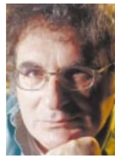
מוריס. אסון לאנושות