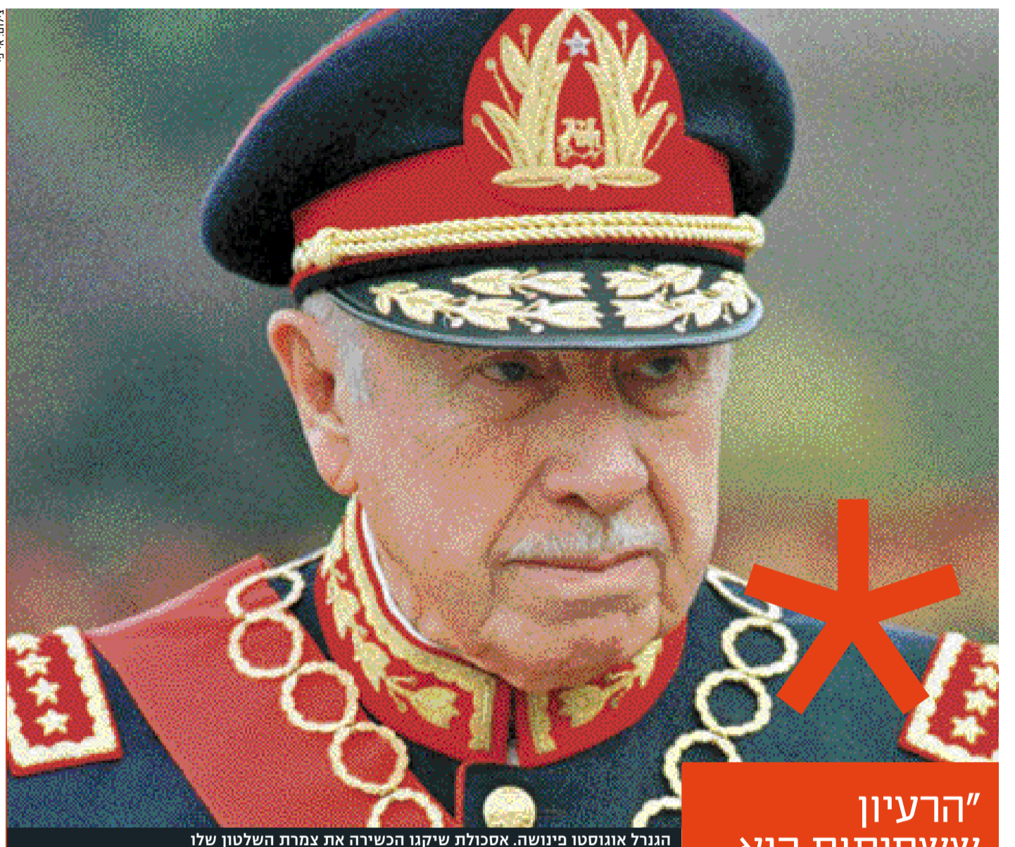
הגנרל אוגוסטו פיננשה. אסכולת שיקגו הכשירה את צמרת השלטון שלו

"הרעיון ששחיתות היא כשעושים דה-רגולציה הוא מטורף. יש קבוצת אינטלקטואלים שבונים את התיאוריה שלהם סביב הדחף האנושי לתאוות בצע והם מופתעים שרואים שחיתות כשמסירים את כל המגבלות"