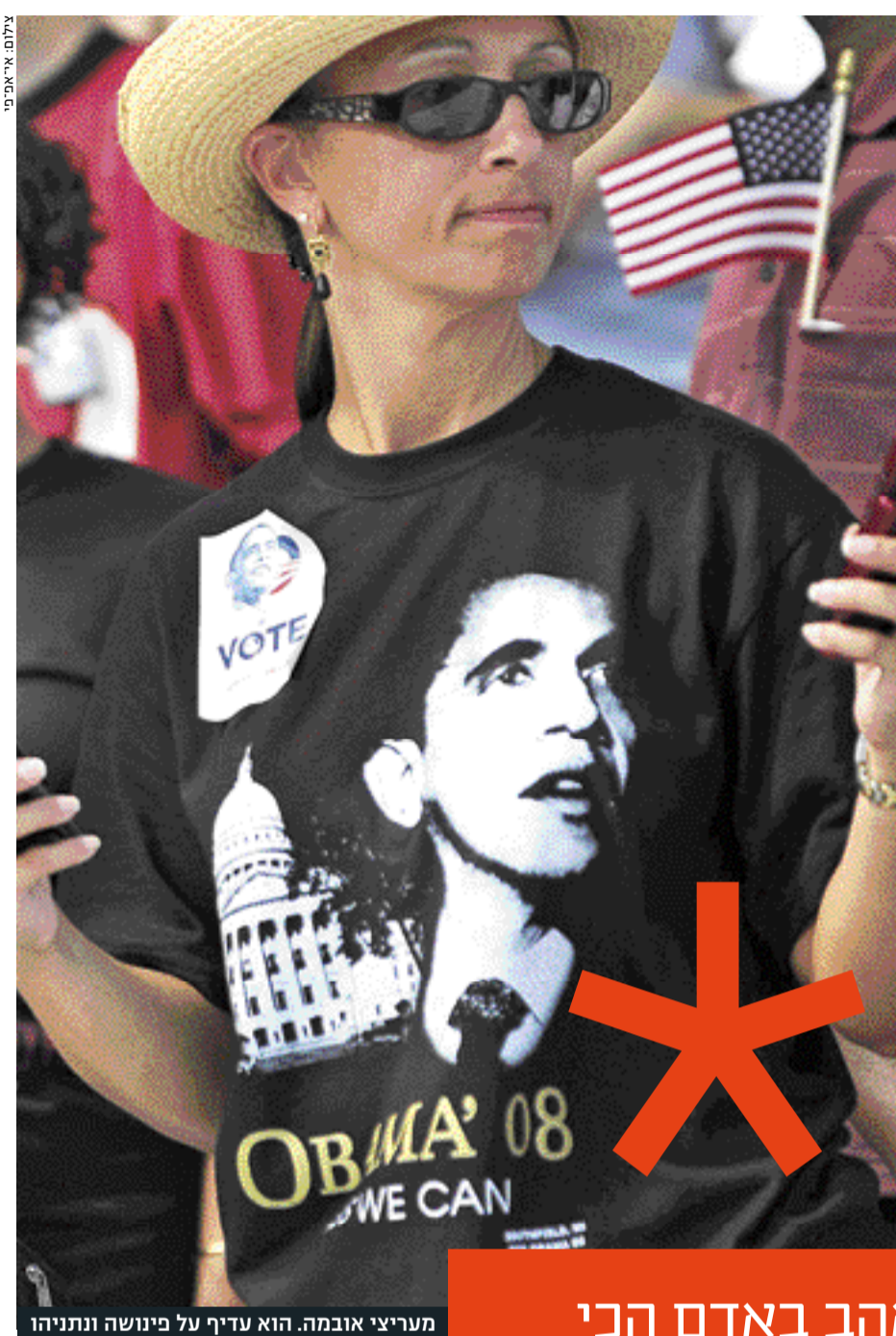
מערציי אובמה. הוא עדיף על פיננשה ונתניהו

קליין מסבירה שאסכולת שיקגו התחזקה בשנות ה-60, על רקע חוסר שביעות הרצון של המגזר העסקי בארצות הברית מכך שבעקבות השפל הגדול, אימץ הממשל האמריקאי עקריו נות סוציאליים, שהיטיבו עם העובדים ופגעו ברווחי בעלי הון. "זה הקשר שבו נולדה התינועה האינטלקטואלית הניאושמרנית וזו הסיבה לכך שחול סטריט מימנה אותה. באותה עת ארצות הברית התאגידית היתה מאוד מוראגנת ומתנונעה של אמריקה הלטינית אל השמאל: מהלאאמת של חברות ומהעצמאות הכלכלית שמדינות אלו גילו. התוכנית של אוניברסיטת שיקגו בצ'ילה נועדה לשנות את האידיאולוגיה של אמריקה הלטינית. היא הביאה את התלמידיים של צ'ילה ללמוד מהכלכלנים הליברליים הקיצוניים ביותר שבאותה עת היו לגמרי מחוץ