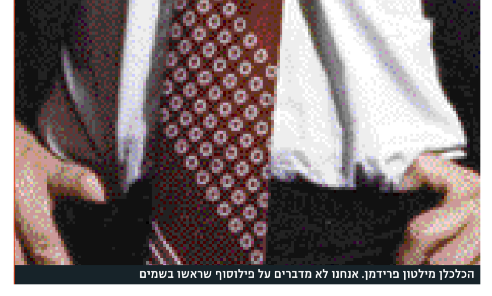
הכלכלן מילטון פרידמן. אנחנו לא מדברים על פילוסוף שראשו בשמים

"בורא" שהיה הרבה יותר פשוט לא להגיע לישראל, אומרת קליין, "וכך הייתי נוהגת אם הוועדה של החרם הפלסטיני היתה מבקשת ממני לעשות כן. אבל באתי אליהם בהצעה לאופן שבו אני רוצה לבקר בישראל, והם היו פתוחים ביותר לקבלה. חשוב לי לא להחרים את ישראל אלא לה" חרים את הנורמליזציה של ישראל ושל הסכסוך". אז למה החלטת לבוא בכל זאת? "קודם כל אני עוסקת בתקשורת, זה המקצוע והתשוקה שלי, ולכן אני מוחאת נגד כל סוג של ניתוק ערוצי ההידברות. אני חושבת שאחד הכי לים החוקים ביותר בידיהם של המתנגדים לחרם הוא הטענה שמדובר בחרם נגד ישראלים. נכון שישנם כמה אנשי אקדמיה שלא יסכימו לקבל מאמר של ישראל לכתב עת. אלה בודדים שמקבלים החלטות טיפשיות. ההחלטה אינה להחרים ישראלים אלא להתנגד לייחסי עם מוסדות יש"ר. אני משתרלת להיות עקבית באופן שבו